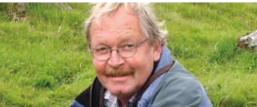
Autor: Peter M. Wettler, Präsident Solarspar- genossenschaft

Jährlich bis 200'000 Franken an die Steuerbehörden abführen oder für den Klimaschutz verwenden und die Rechtsform ändern? Vor diese knifflige Gretchenfrage sah sich der Solarspar-Vorstand gestellt.