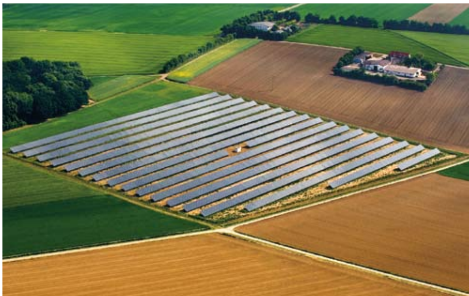
Auf über 5 Hektaren liefert im deutschen Gnodstadt nahe Würzburg ein sogenanntes Freiflächen-Solarkraftwerk seit 2007 jedes Jahr zuverlässig rund 1,6 Mio Kilowattstunden sauberen erneuerbaren Strom.

wird es bereits billigere Energie produzieren, zweieinhalb mal soviel geliefert haben wie ein Kohlekraftwerk und vor allem problemloser finanziert worden sein, weil es schon im ersten Jahr Einkommen generiert. Kommt dazu, dass es aus einer Hochleistungsbranche stammt, die ein solches Solarkraftwerk etwa alle 20 Monate reproduzieren kann.